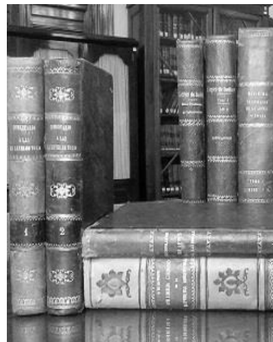
Colección "Fondo Antiguo"